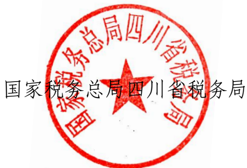
国家税务总局四川省税务局